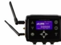
MONITEUR (POUR FLOTTE DE CAMIONS)