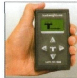
Appareil de poche du conducteur

Contrôlez le poids depuis un endroit pratique et sécuritaire.