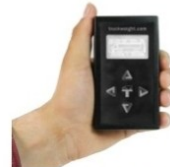
BALANCE INTELLIGENTE (SANS FIL)